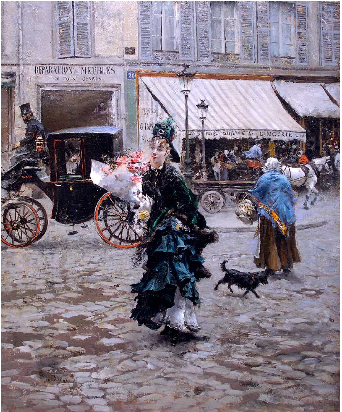
Giovanni Boldini, Attraversando la strada, 1875.